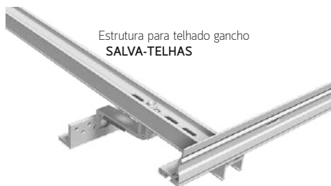
Estrutura para telhado gancho SALVA-TELHAS

Estrutura em alumínio de alta qualidade. Fixação com salva-telhas e regulação da altura.