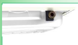
Ligações roscadas Macho/Fêmea de 1"