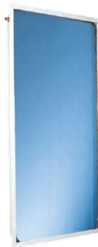
THK 25 V (vertical)