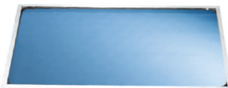
THK 25 H (horizontal)