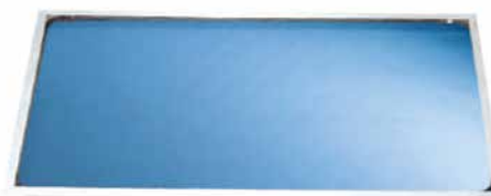
THK 25 H (horizontal)

Parte de trás do THK 25 Construção da cuba estampada com elevada durabilidade e resistência.