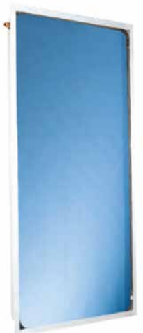
THK 25 V (vertical)