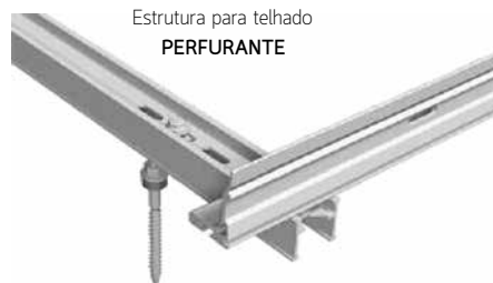
Estrutura para telhado PERFURANTE

Estrutura em alumínio de alta qualidade. Fixação com salva-telhas e regulação da altura.