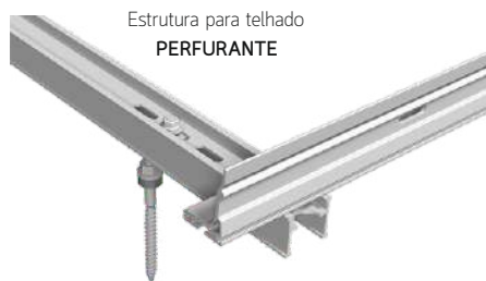
Estrutura para telhado PERFORANTE

Estrutura em alumínio de alta qualidade. Fixação com salva-telhas e regulação da altura.