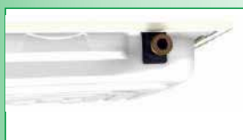
Ligações roscadas Macho/Fêmea de 1"