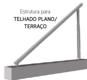
Estrutura para TELHADO PLANO/ TERRAÇO

Estrutura em alumínio de alta qualidade. Fixação perfurante com fixador em INOX.