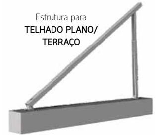
Estrutura para TELHADO PLANO/ TERRAÇO

Estrutura em alumínio de alta qualidade. Fixação perfurante com fixador em INOX.