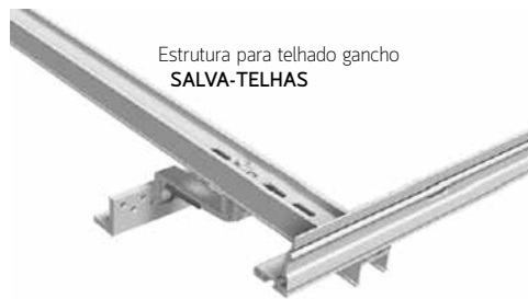
Estrutura para telhado gancho SALVA-TELHAS

Estrutura em alumínio de alta qualidade. Fixação com salva-telhas e regulação da altura.